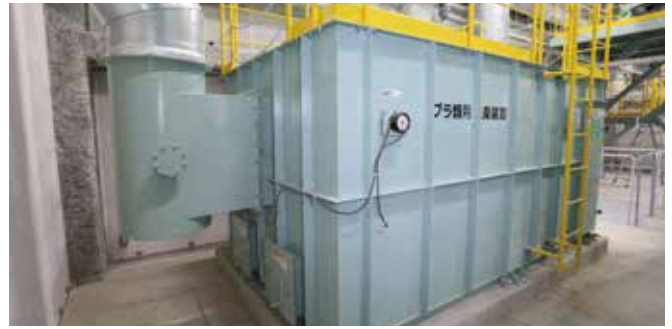
⑧ プラスチック類用脱臭装置・不燃粗大用脱臭装置 各所から発生する臭気を活性炭で吸着して、クリーンな空気として屋外に排気します。