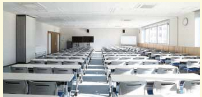
多目的室(団体用環境学習室) 施設の役割やごみの減量などについて解説するビデオを上映します。