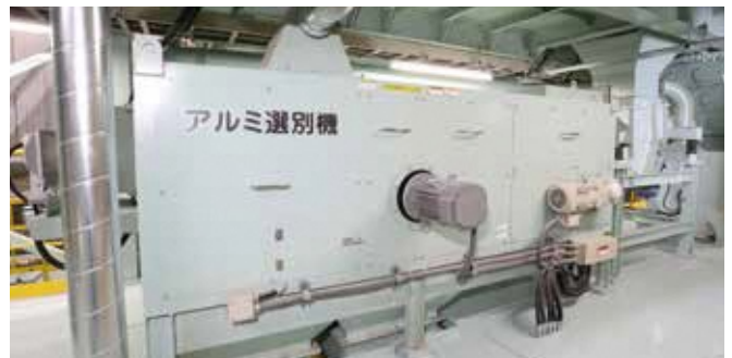
⑫ アルミ選別機 うず電流により破砕物の中からアルミ類を取り出すものです。