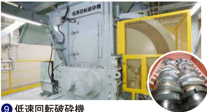
⑨ 低速回転破砕機 ゆっくりと回転する(約10回転/分)刃でゴミを大まかに破砕し、 次の破砕処理をスムーズにするためのものです。