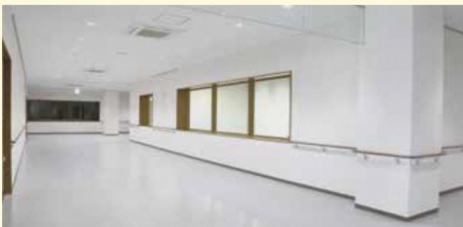
見学者通路 実際の設備を見学しながら資源化施設のしくみを学ぶことができます。