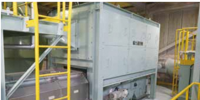
⑪ 磁力選別機 電磁石を使って破砕物の中から鉄類を取り出すものです。