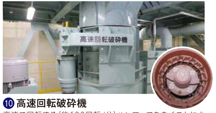
⑩ 高速回転破砕機 高速で回転する(約600回転/分)ハンマーでたたくことにより、 さらに細かくするものです。細かく破砕することにより下流で選別しやすくなります。