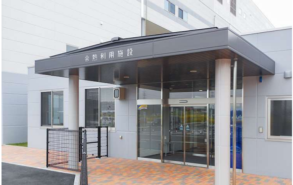
余熱利用施設外観