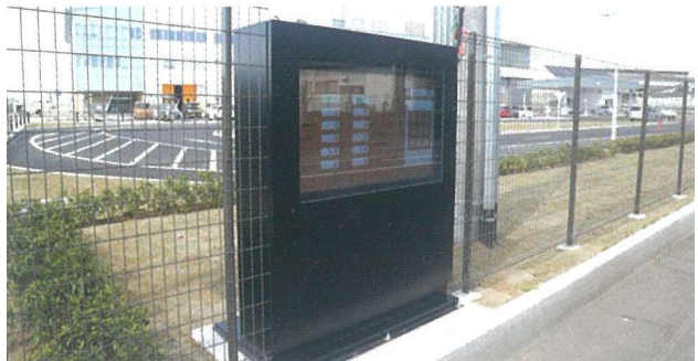
リアルタイム発電パネル