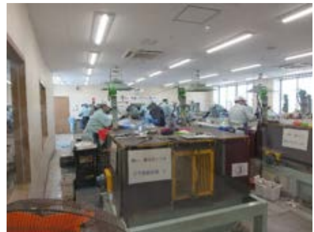
プラスチック類選別