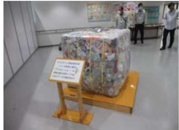
プラスチック容器包装バール実物大模型