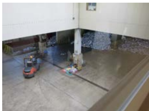
プラットフォーム（プラスチック側）