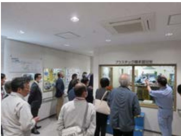
プラスチック類選別