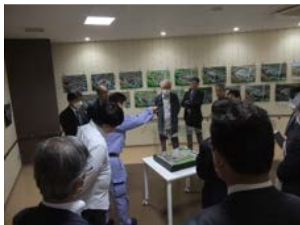
パネル・模型展示