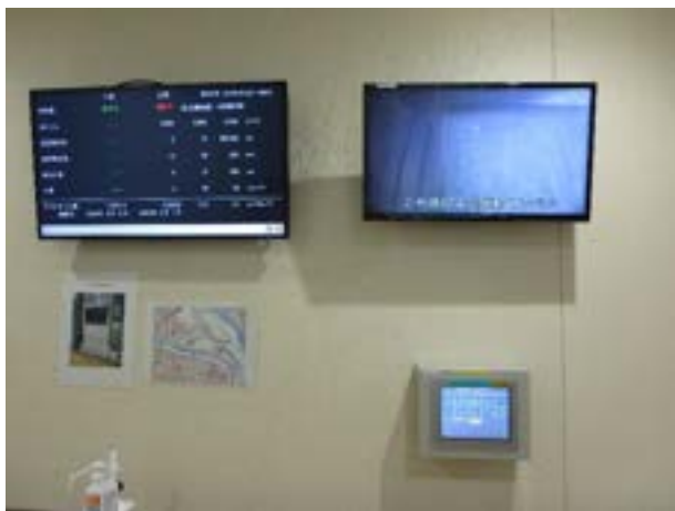
測定値表示モニター