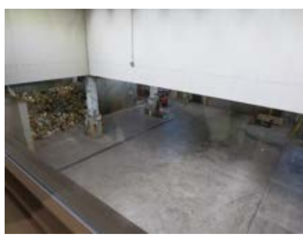
プラットフォーム（不燃ごみ側）