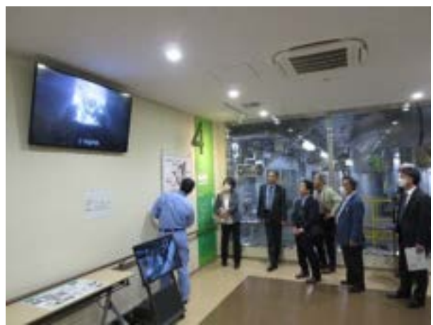
炉内表示モニター