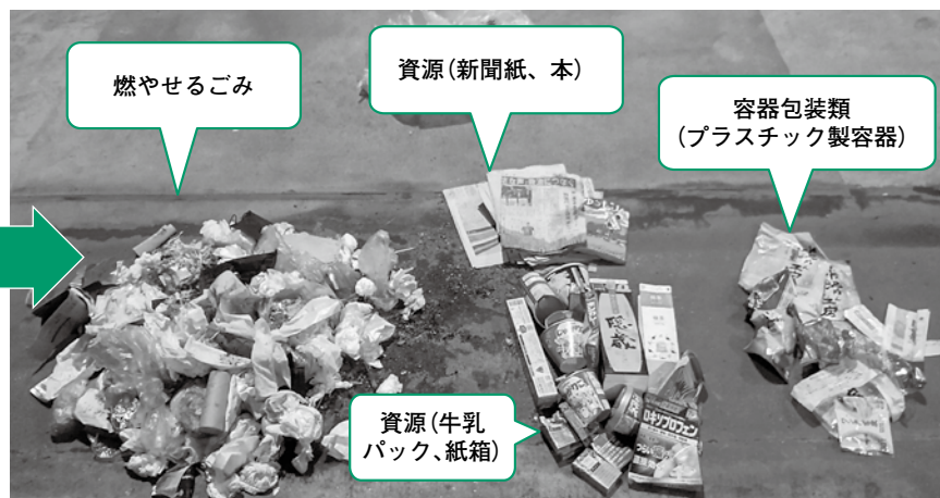
調査した袋の中身

令和5年2月10日の調査では、容器包装類は少なく、資源では新聞紙、牛乳パック等が含まれていました。