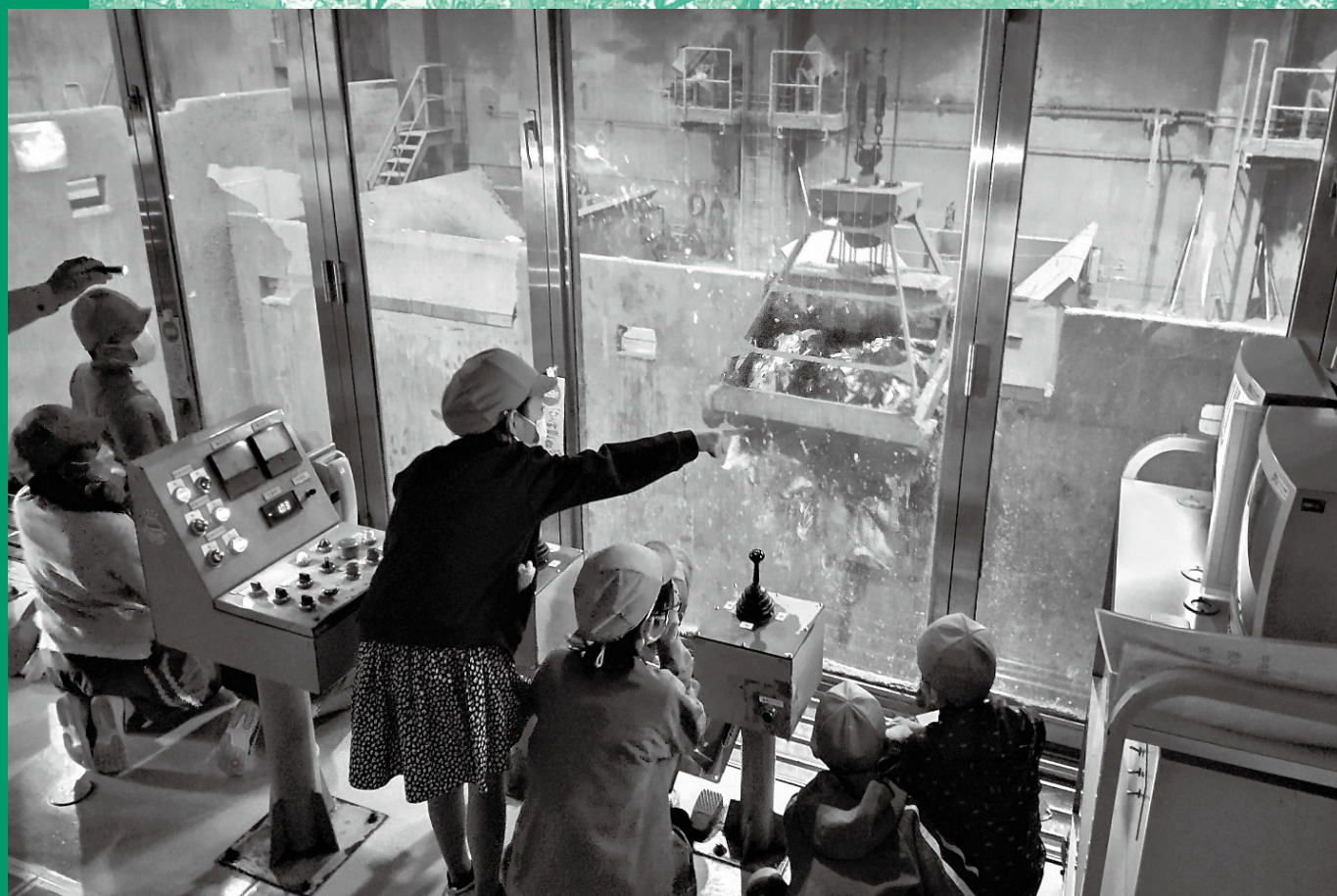
施設見学：小学校の生徒さん(6ページに記事掲載)